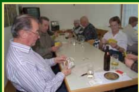
Einladung zum Preisjassen des Pensionistenverbandes Bludesch

Termin: Do. 26. Jänner 2012 Beginn: 15.00 Uhr Ort: Kindergarten Gais Einsatz: € 5,00