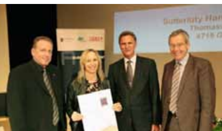
Ausgezeichneter Lehrbetrieb Sutterlüty