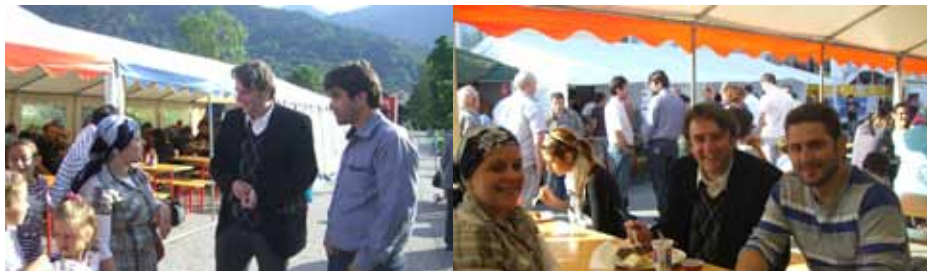
Zum Tag der offenen Tür hatte der türkische Verein „Atib“ eingeladen.