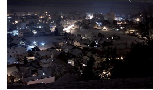
Mit der Umstellung auf LED-Beleuchtung soll die Lichtverschmutzung verringert werden

geprüft, kommt jedoch aufgrund der hohen Kosten nicht in Frage. Jede Leuchte kann zeitgesteuert programmiert werden. Für die Umstellung von 141 Lichtpunkten wurden vier Angebote eingeholt. Optional könnten auch die Fuß- und Radwege (zusätzlich 22 Lichtpunkte) umgestellt werden. Bei den Fuß- und Radwegen gibt es zudem interessante Fördermöglichkeiten (Strukturförderung 15%, Landesförderung 50%, weitere Förderungen werden noch geprüft). Auch hier wurden vier Angebote eingeholt. Die Arbeitsgruppen „e5“ und „Verkehr, Bau und Infrastruktur“ haben sich ebenfalls mit dem Thema befasst und befürworten eine Umstellung der Straßenbeleuchtung auf LED. Nach Diskussion wird einstimmig beschlossen, die Straßenbeleuchtung auf LED umzustellen. Hinsichtlich der 141 Lichtpunkte wird der Auftrag einstimmig an den Best- und Billigstbieter Elektro Pfaff vergeben. Auch der Auftrag für die optionalen 22 Lichtpunkte für die Rad- und Gehwege wird an Elektro