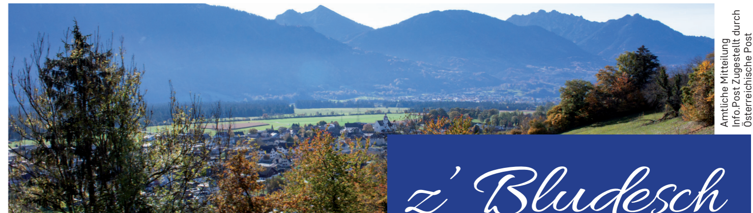
Informationen der Gemeinde Bludesch, September 2021