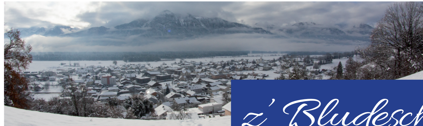
Informationen der Gemeinde Bludesch, Dezember 2020