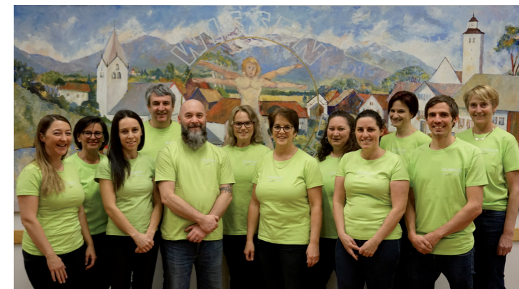
Das „familieplus“ Team zeigt großartiges Engagement für Familienfreundlichkeit