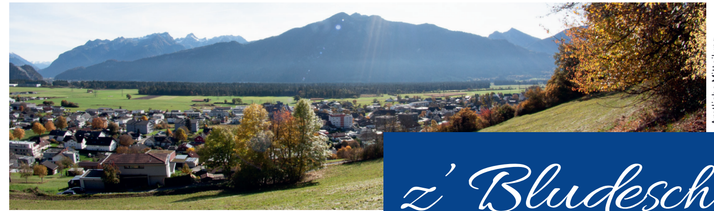
Informationen der Gemeinde Bludesch, Oktober/November 2020